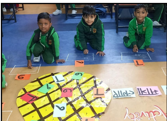
मात्रा लगाए Hindi Activity