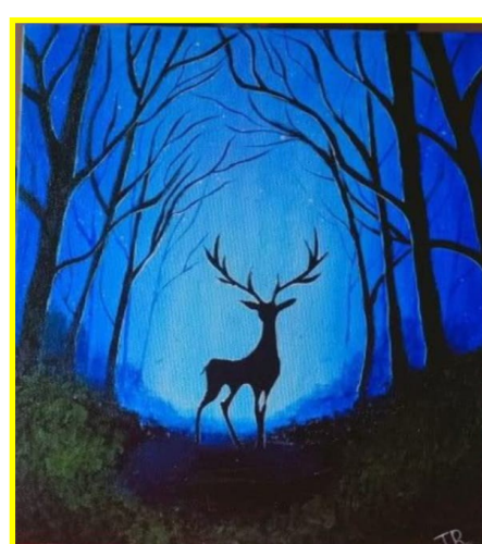
Jhanvi (Class VI)