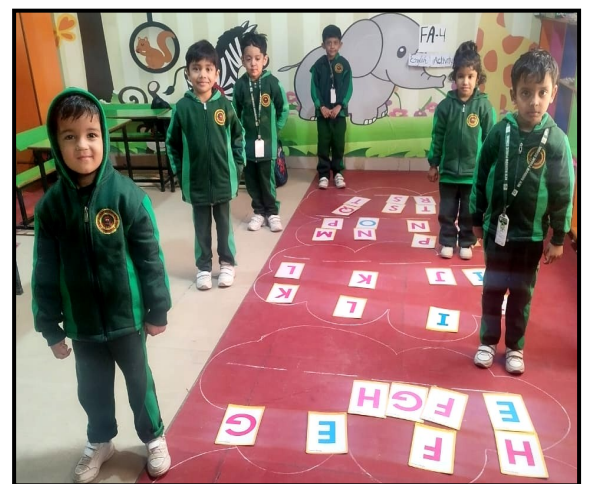
Alphabetical Series Activity for Pre-Primary Wing