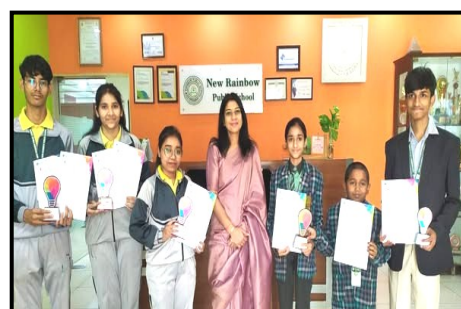
Winners in CREO INTERNATIONAL 2024 by Nehru World School.