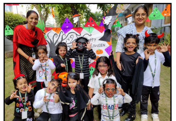
Halloween Day Celebration