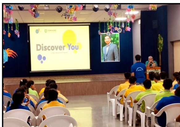
Career Counselling Session