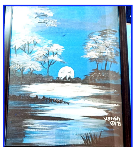
Vansh (Class VII)