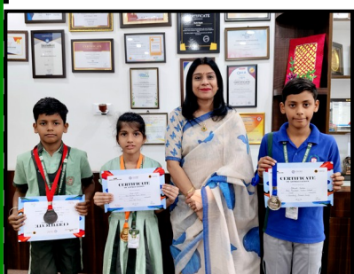
Winners in SYENERGY by Gurukul-The School

Our young athletes also demonstrated their prowess in sports at an inter-school competition organized by Gurukul The School, achieving impressive victories. Adding to these triumphs, the students excelled in Veethika, hosted by DAV School, securing numerous prizes and proving their versatility. These accomplishments are a testament to the unwavering dedication of our students, the guidance of their teachers, and the support of their parents. Heartfelt congratulations to all the winners and participants for making the NRPS family proud!