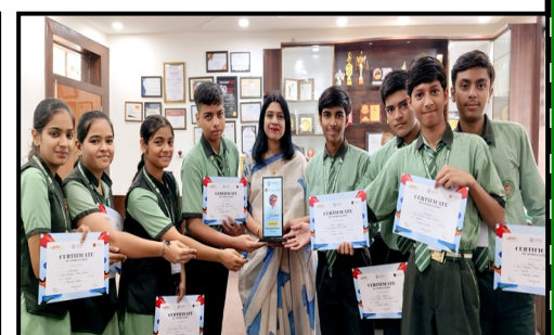
Winners in Nukkad Natak Interschool Competition by Gurukul-The School