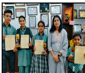
Winners in VEETHIKA by DAV Public School