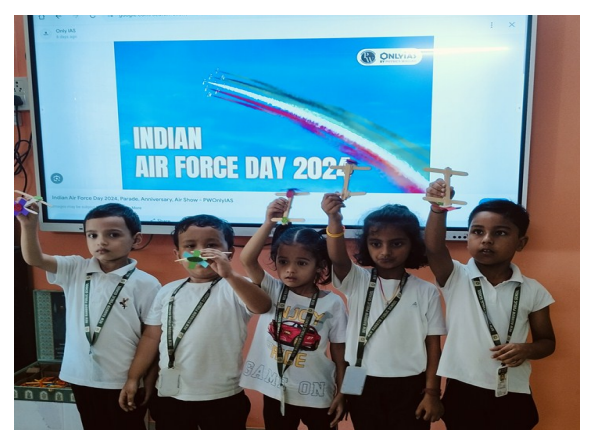
Indian Air Force Day Celebration