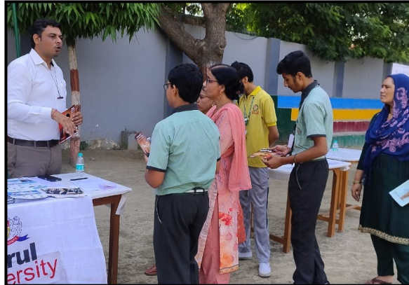
Education Fair at NRPS