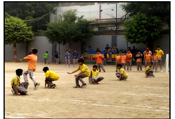
Inter-House Kho-Kho Competition