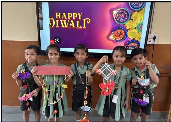
Wall Hanging Making Activity On Diwali