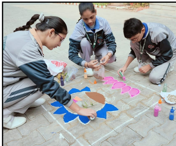
Talunt Hunt by Maharishi Dayand Vidyapeeth