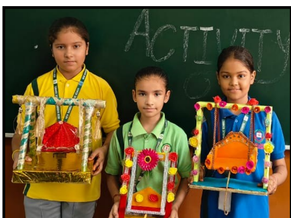
Krishna Janmashtami Activity