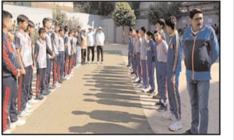
गया भागीरथ पब्लिक स्कूल ने पहले बल्लेबाजी करते हुए 8 ओवर में हुए 60 रन बनाये। गुरुकुल द स्कूल ने भी 8 ओवर में 60 रन बनाए। मैच टाई होने पर सुपर ओवर का सहारा लिया गया जिसमें गुरुकुल द स्कूल ने बाजी मारी।